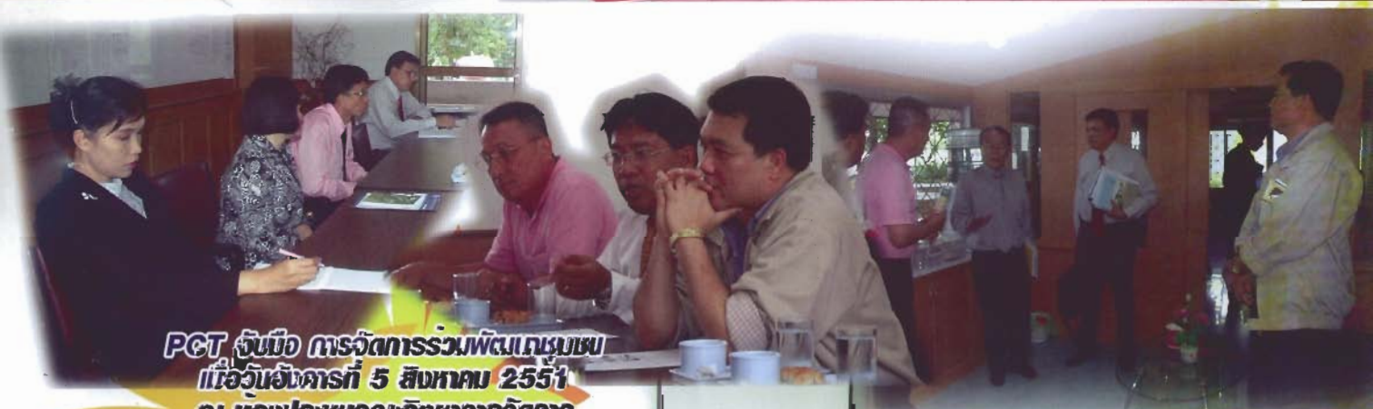
PCT จับมือ การจัดการร่วมพัฒนชุมชน เมื่อวันที่ 5 สิงหาคม 2551 ณ ห้องประชุมคณะวิทยาการจัดการ