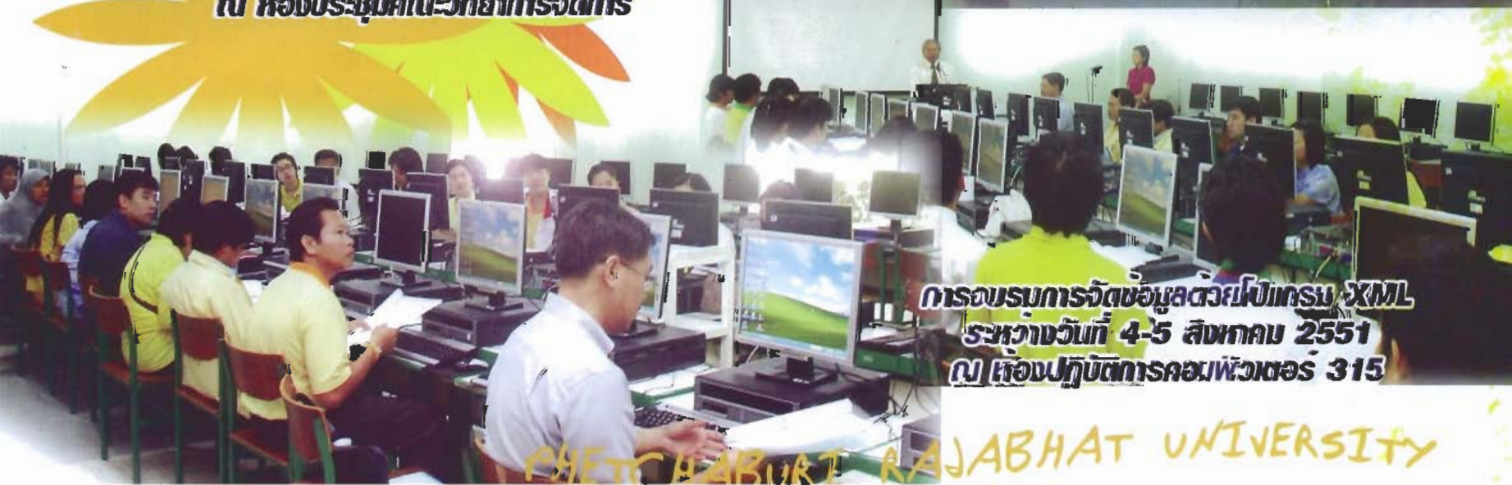
การอบรมการจัดข้อมูลด้วยโปรแกรม XML ระหว่างวันที่ 4-5 สิงหาคม 2551 ณ ห้องปฏิบัติการคอมพิวเตอร์ 315