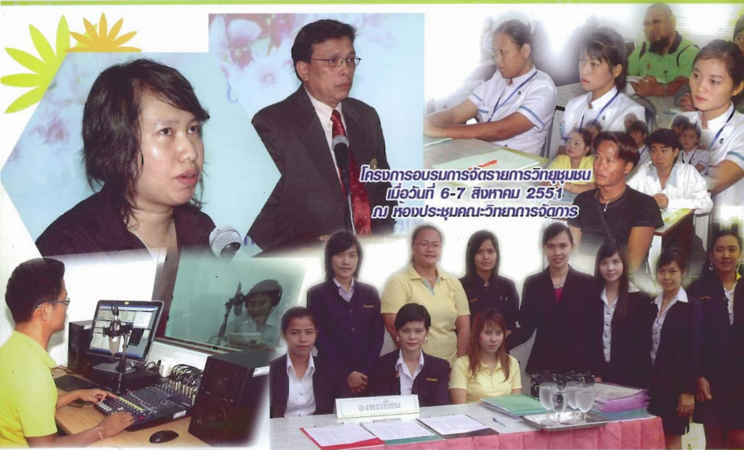
โครงการอบรมการจัดรายการวิทยุชุมชน เมื่อวันที่ 6-7 สิงหาคม 2551 ณ ห้องประชุมคณะวิทยาการจัดการ

สถาบันอุดมศึกษาเพื่อป้องกันและเพื่อการพัฒนาท้องถิ่น