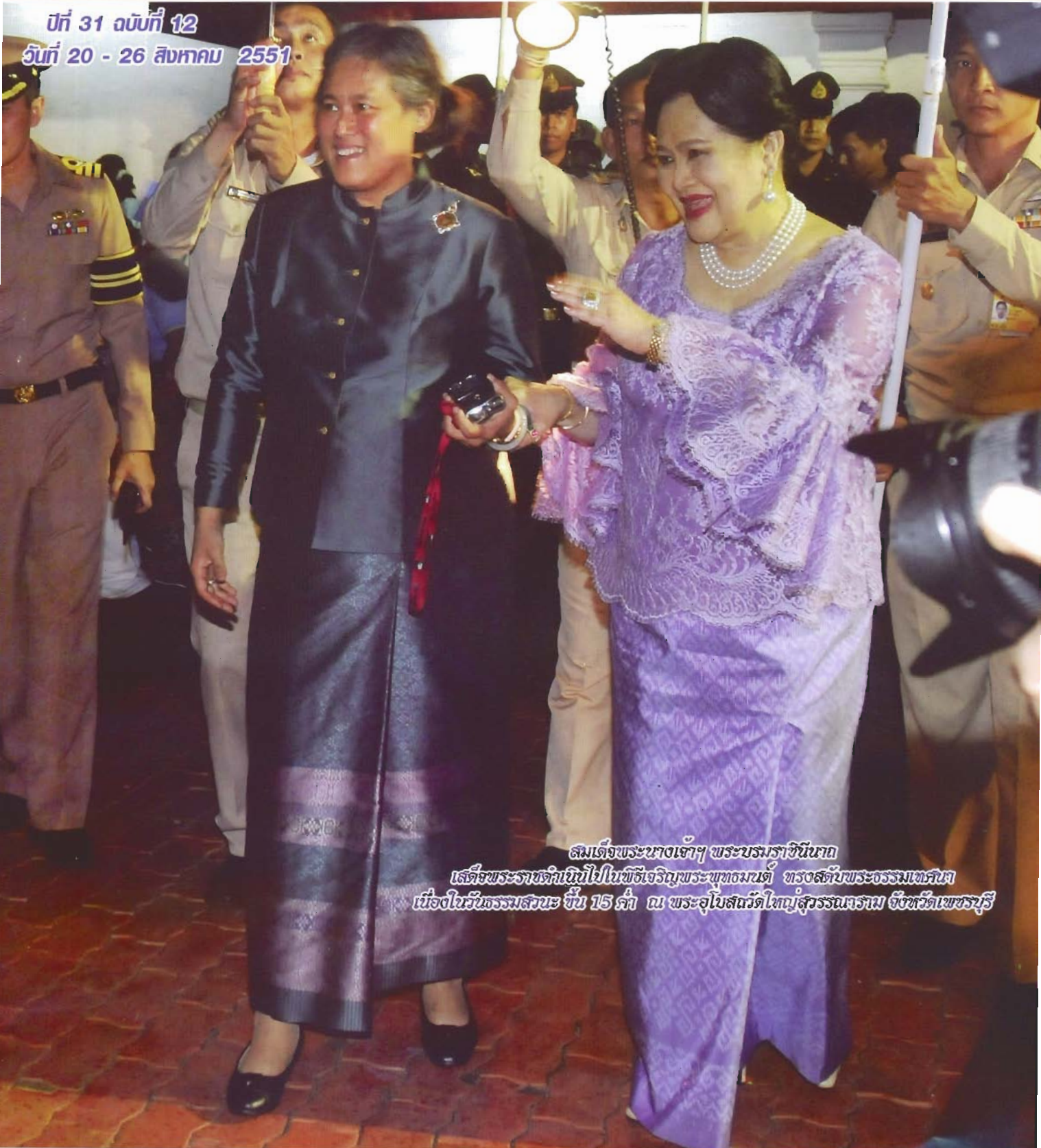
สมเด็จพระนางเจ้าฯ พระบรมราชินีนาถ เสด็จพระราชดำเนินไปในพิธีเจริญพระพุทธมนต์ ทรงสดับพระธรรมเทศนา เนื่องในวันธรรมสวนะ ขึ้น 15 ค่ำ ณ พระอุโบสถวัดใหญ่สุวรรณาราม จังหวัดเพชรบุรี