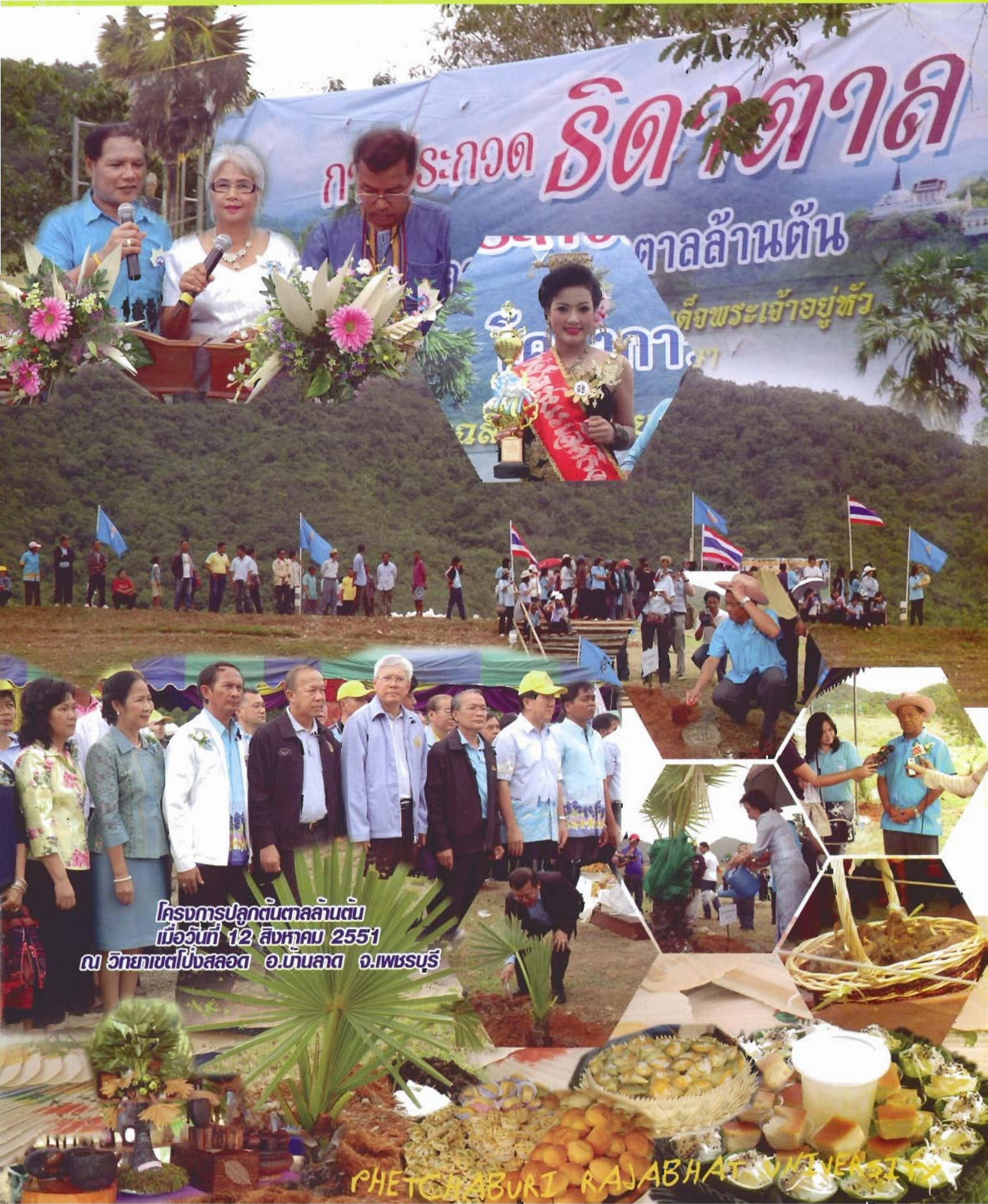
โครงการปลูกต้นตาลล้านต้น เมื่อวันที่ 12 สิงหาคม 2551 ณ วิทยาเขตโป่งสลอด อ.บ้านลาด จ.เพชรบุรี