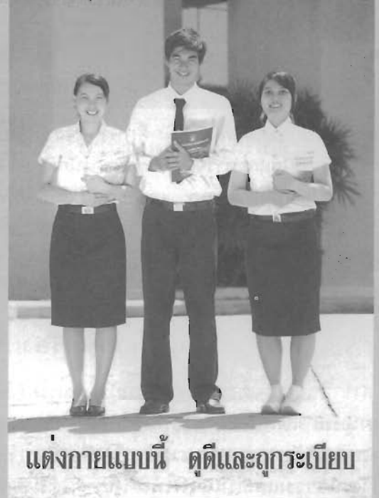
แต่งกายแบบนี้ ดุติและถูกระเบียบ

ในการนี้ กองพัฒนานักศึกษาจึงขอความร่วมมือจากอาจารย์ผู้สอน ขอความอนุเคราะห์ที่ได้ช่วยกันกวดขันการแต่งกายของนักศึกษา ในชั้นเรียนด้วยเพื่อความเรียบร้อยและบังเกิดภาพลักษณ์ที่ดีของมหาวิทยาลัย กองพัฒนานักศึกษา ขอขอบพระคุณในความร่วมมือของคณาจารย์ทุกท่านเป็นอย่างสูงมา ณ โอกาสนี้