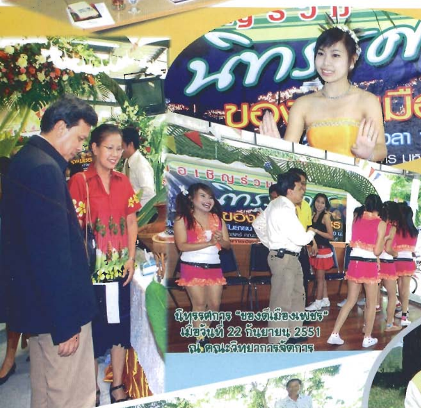
พิธีรณรงค์ "ของดีเมืองเพชร" เมื่อวันที่ 22 กันยายน 2551 ณ คณะวิทยาศาสตร์