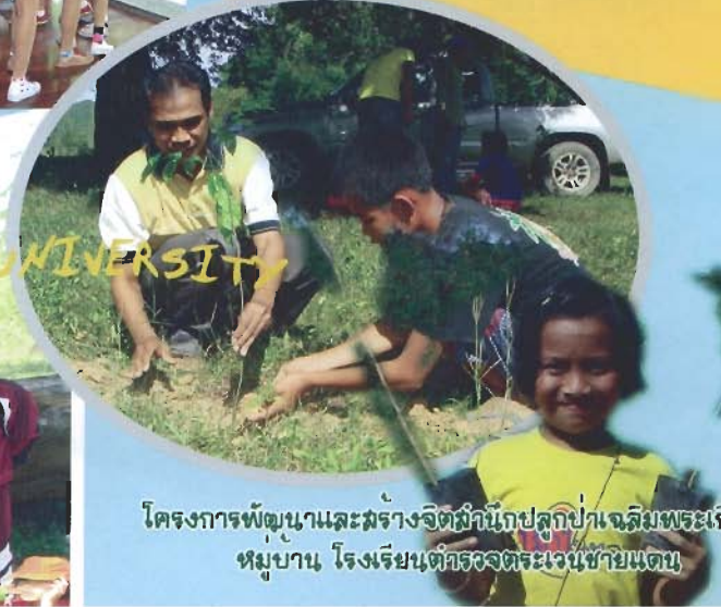
โครงการพัฒนาและสร้างจิตสำนึกปลูกป่าเฉลิมพระเกียรติ หมู่บ้าน โรงเรียนตำรวจตระเวนชายแดน