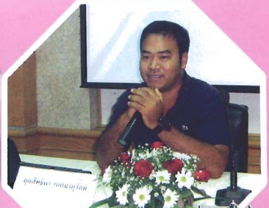
สัมมนา How To Get The Jobs? ทำงานอย่างไรให้โตงาน เมื่อวันที่ 16 กันยายน 2551 ณ ห้องบัณฑิต 1 ชั้น 3 คณะมนุษยศาสตร์