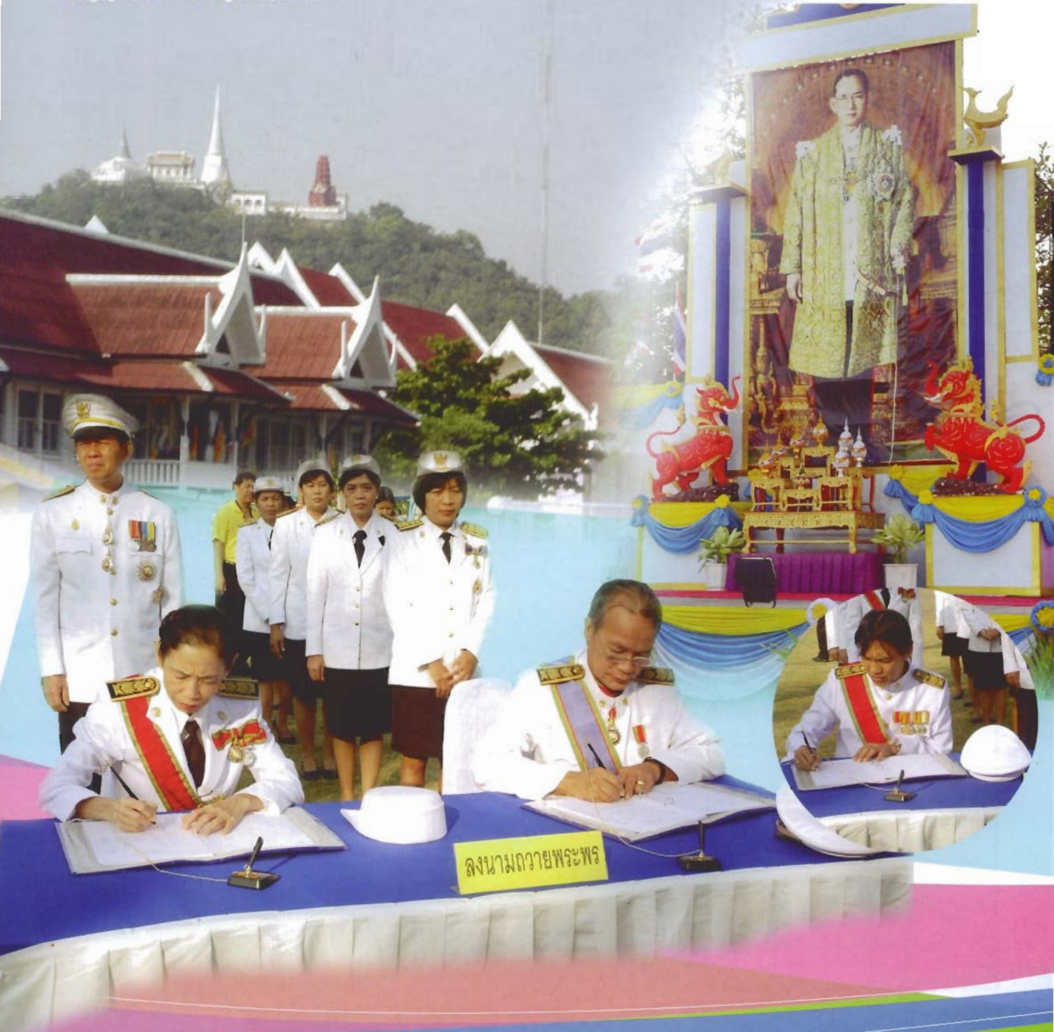
ลงนามถวายพระพร