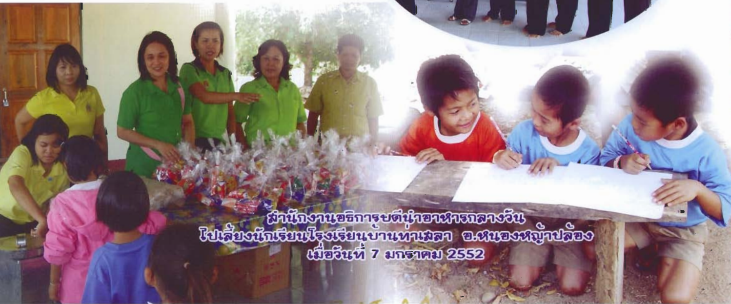
สำนักงานอธิการบดีนำอาหารกลางวัน ไปเลี้ยงนักเรียนโรงเรียนบ้านท่ามะลา อ.หนองหญ้าปล้อง เมื่อวันที่ 7 มกราคม 2552