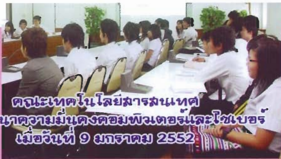
จัดประชุมในโลยี่สารลงเขต จัดสัมมนาความมั่นคงคอมพิวเตอร์และไซเบอร์ เมื่อวันที่ 9 มกราคม 2552