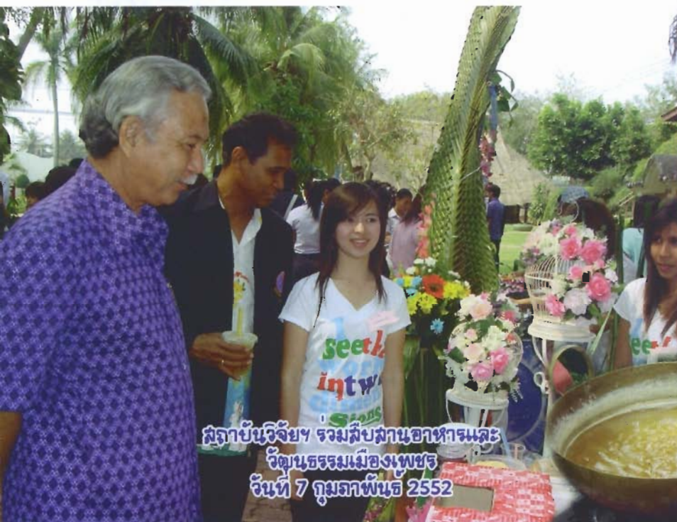
สัปดาห์วิจัยฯ รวมสืบสานอาหารและ วัฒนธรรมเมืองเพชร วันที่ 7 กุมภาพันธ์ 2552

สถาบันอุดมศึกษาเพื่อปวงชนและเพื่อการพัฒนาท้องถิ่น