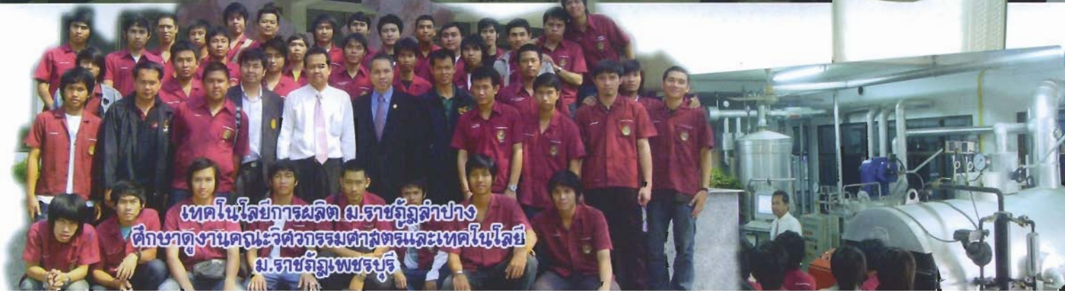
เทคโนโลยีการผลิต ม.ราชภัฏสุราษฎร์ธานี ศึกษาดูงานคณะวิศวกรรมศาสตร์และเทคโนโลยี ม.ราชภัฏเพชรบุรี