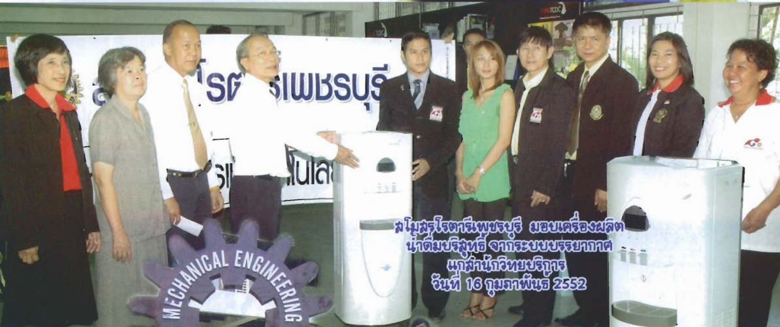
สโมสตร์โรตารีเพชรบุรี มอบเครื่องผลิต น้ำดื่มบริสุทธิ์ จากระบบบรรยากาศ แก่สำนักวิทยบริการ วันที่ 16 กุมภาพันธ์ 2552