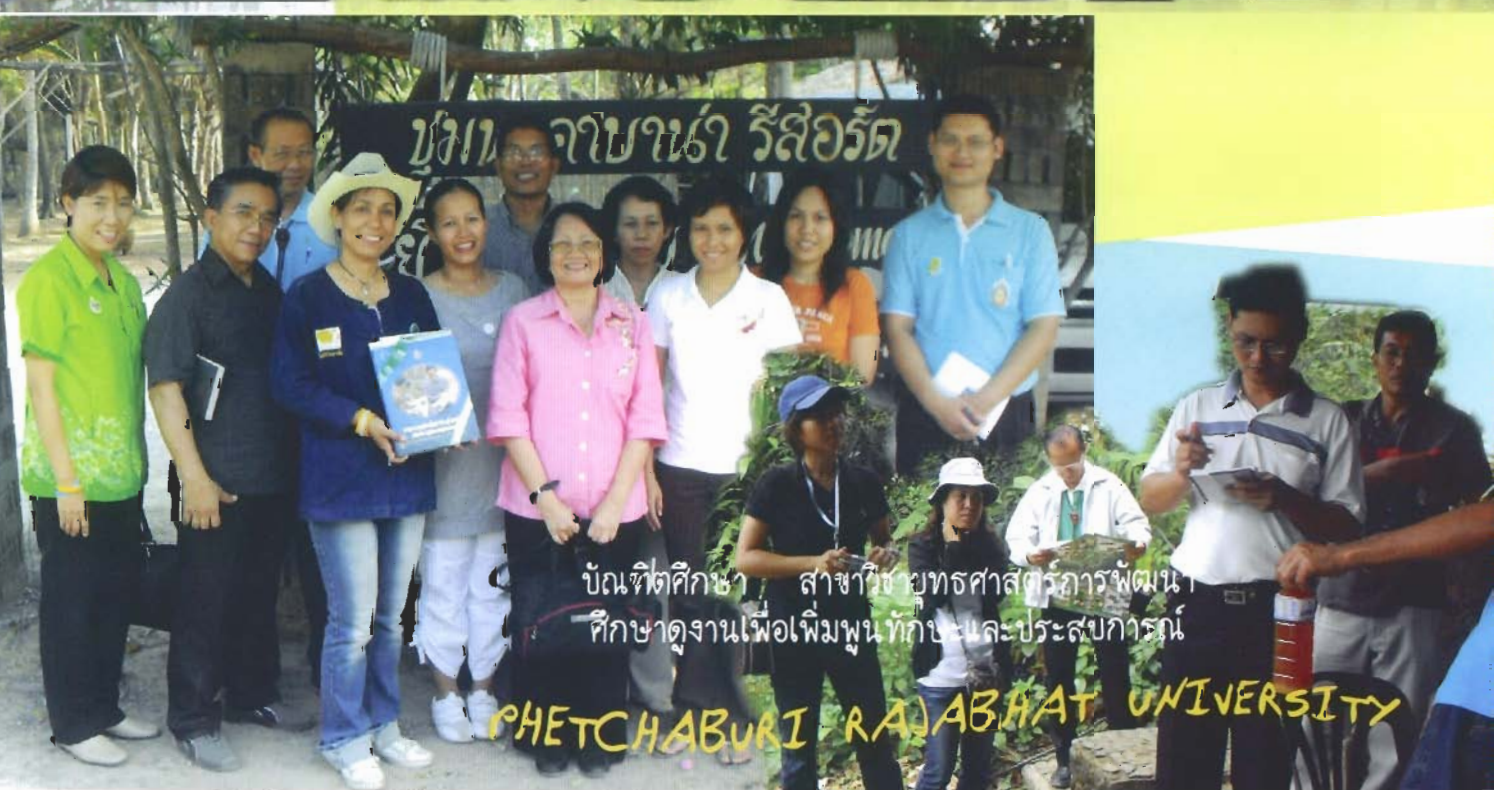
บัณฑิตศึกษา สาขาวิชาวิทยาศาสตร์การพัฒนาศึกษา ศึกษาดูงานเพื่อเพิ่มพูนทักษะและประสบการณ์