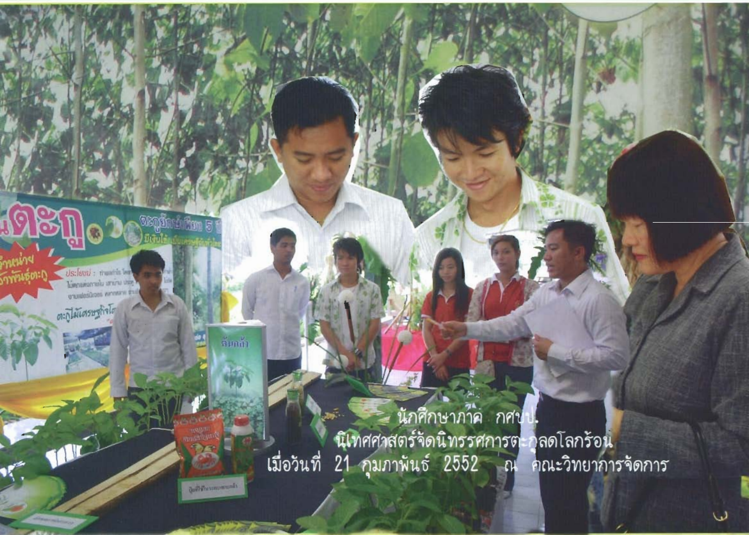
นักศึกษาภาค กศบป. นิเทศศาสตร์จัดนิทรรศการตะกั่วโลกร้อน เมื่อวันที่ 21 กุมภาพันธ์ 2552 ณ คณะวิทยาการจัดการ

สถาบันอุดมศึกษาเพื่อปวงชนและเพื่อการพัฒนาท้องถิ่น