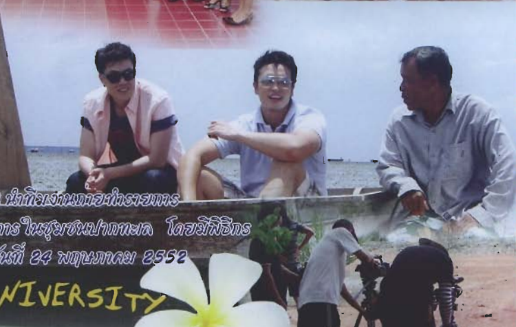
บริษัท Holiday Maker Travel จำกัด ฝั่งที่โรงแรมทราเวลทราเวล อิมละไม ช่องไทยทีวีช่อง 3 ท่องเที่ยวในรัฐชนป่าทะเล โดยอิมพิอริ ราช/ชาติโรคม ออกอากาศเมื่อวันที่ 24 พฤษภาคม 2552