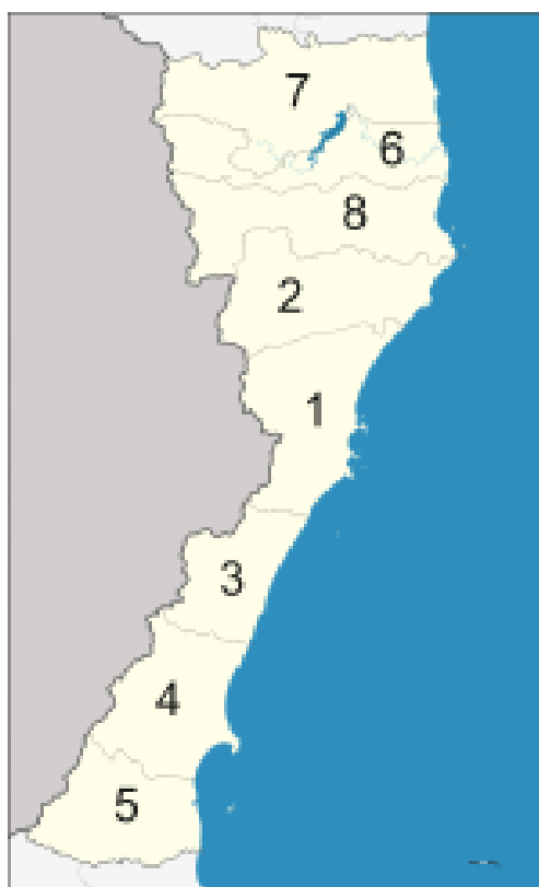
ภาพที่ 2.1 แผนที่จังหวัดประจวบคีรีขันธ์

คำขวัญประจำจังหวัด : เมืองทองเนื้อเก้า มะพร้าว สับปะรด สวยสด หาด เขา ถ้ำ งามล้ำน้ำใจ