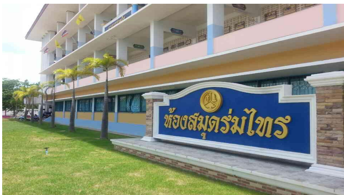
ภาพที่ 4.6 การปรับปรุงบรรยากาศภายนอกของห้องสมุดโรงเรียน

2.4 การปรับปรุงการจัดหนังสือภายในของห้องสมุดโรงเรียน แสดงได้ดังภาพที่ 4.7