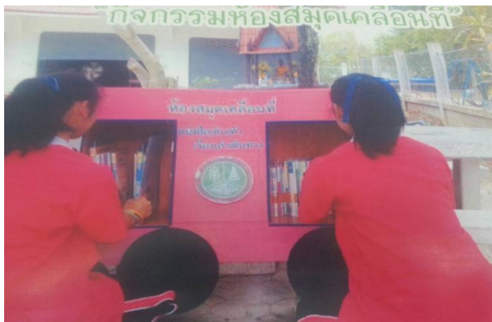
ภาพที่ 4.13 กิจกรรมห้องสมุดเคลื่อนที่

ผลการกิจกรรมห้องสมุดเคลื่อนที่คือ นักเรียนมีทักษะและตระหนักในคุณค่าทางด้านภาษา นักเรียนและชุมชนมีนิสัยรักการอ่านและการค้นคว้า รวมทั้งนักเรียนได้ฝึกคิดวิเคราะห์และสรุปใจความจากเรื่องที่อ่าน