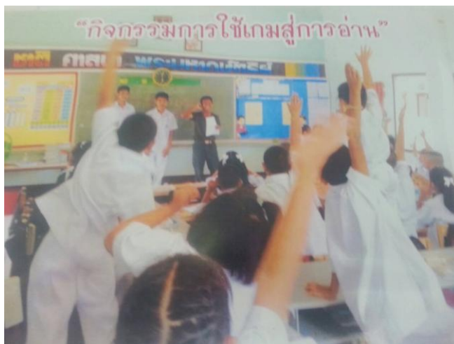
ภาพที่ 4.17 กิจกรรมการใช้เกมสู่การอ่าน

ผลการจัดกิจกรรมการใช้เกมสู่การอ่าน คือ ทำให้นักเรียนสนใจเข้าร่วมกิจกรรมในห้องสมุดมากขึ้น และทำให้สนุกกับการได้เรียนรู้จากหนังสือในห้องสมุดมากขึ้น