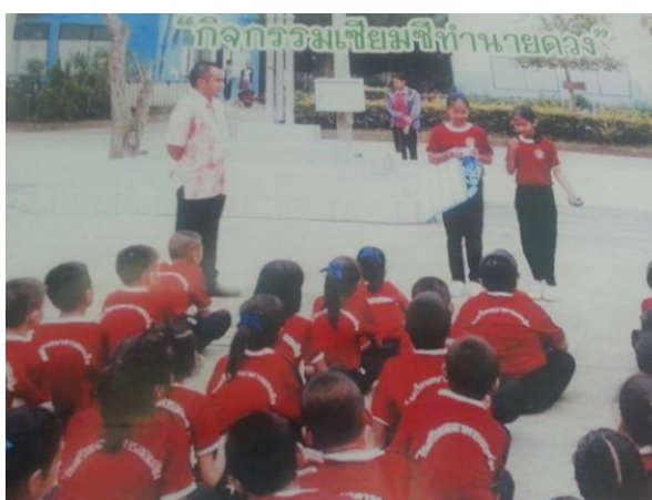
ภาพที่ 4.18 กิจกรรมเชื่อมชีต่านายดวง

ผลการจัดกิจกรรมการใช้เกมสู่การอ่าน คือ ทำให้นักเรียนสนใจเข้าร่วมกิจกรรมในห้องสมุดมากขึ้น และทำให้สนุกกับการได้เรียนรู้จากหนังสือในห้องสมุดมากขึ้น