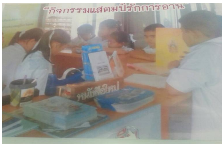
ภาพที่ 4.14 กิจกรรมแสดมป้ร้กการอ่าน

ผลการกิจกรรมห้องสมุดเคลื่อนที่คือ นักเรียนมีทักษะและตระหนักในคุณค่าทางด้านภาษา นักเรียนและชุมชนมีนิสัยรักการอ่านและการค้นคว้า รวมทั้งนักเรียนได้ฝึกคิดวิเคราะห์และสรุปใจความจากเรื่องที่อ่าน