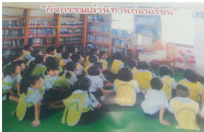
ภาพที่ 4.11 กิจกรรมเล่านิทานก่อนเรียน

ผลการจัดกิจกรรมเล่านิทานก่อนเรียน คือ นักเรียนให้ความสนใจและเพื่อกระตุ้นให้นักเรียนมีความอยากรู้ อยากร้อ่านจากหนังสือหลายประเภท เป็นการเปิดความคิดให้กว้างและให้มีการอ่านอย่างต่อเนื่อง