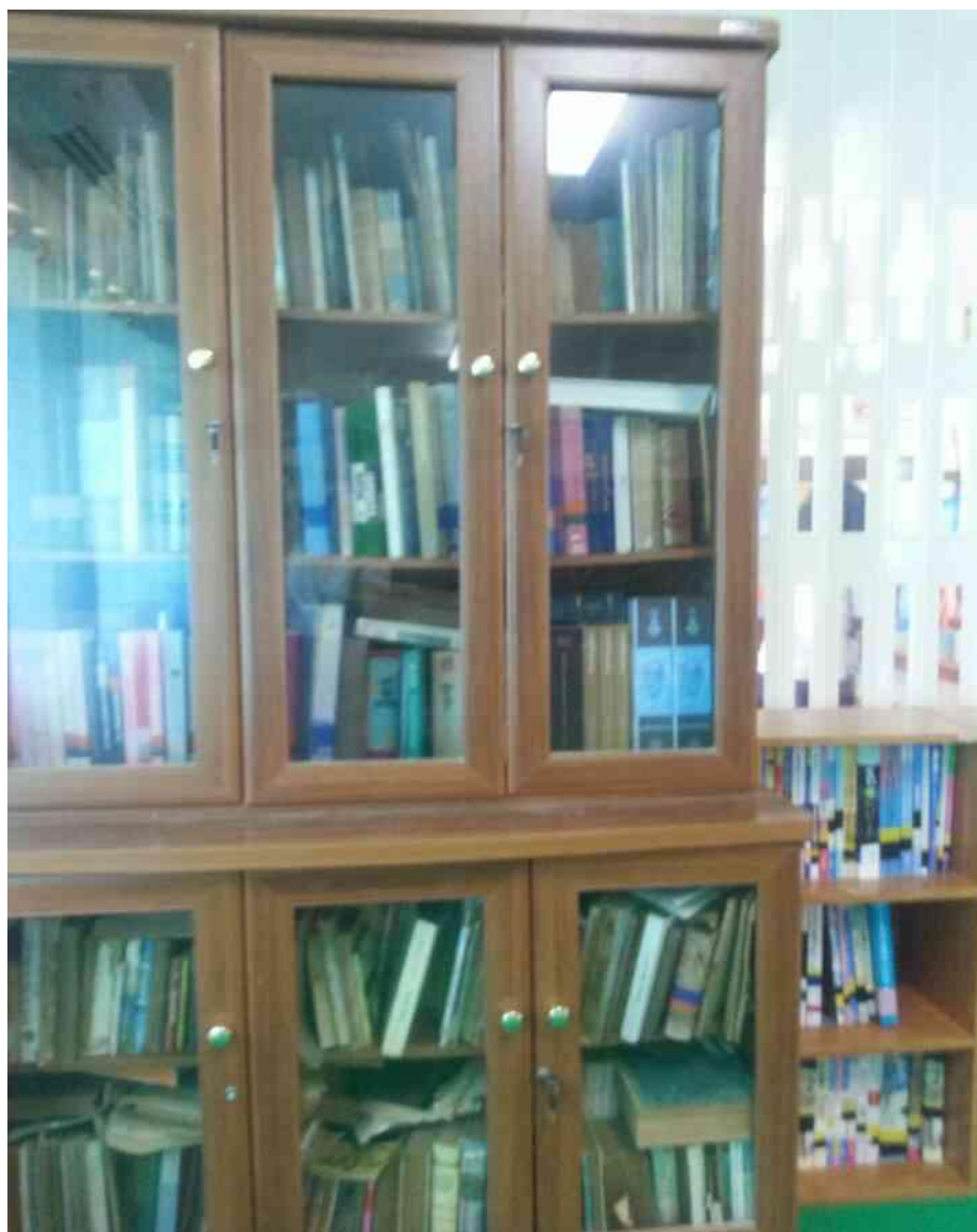
ภาพที่ 4.3 หนังสือในห้องสมุดของโรงเรียนธนาคารอมสิน

2. จากผลการสำรวจสภาพของห้องสมุด ด้านบรรยากาศที่ไม่เอื้ออำนวย มีการจัดภายในห้องสมุดที่ไม่เป็นสัดส่วน ผู้วิจัยได้ดำเนินการพัฒนาร่วมกับครูผู้สอนดังนี้