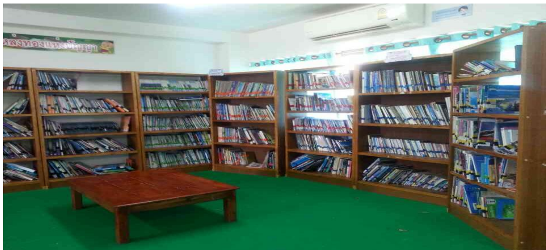
ภาพที่ 4.7 การปรับปรุงการจัดหนังสือภายในของห้องสมุดโรงเรียน

3. จากผลการสำรวจสภาพของห้องสมุด ด้านบรรณารักษ์ พบว่า ไม่มีบรรณารักษ์ที่อยู่ในห้องสมุดเป็นประจำ ซึ่งผู้วิจัยและครูผู้สอนในโรงเรียน จึงได้มีการจัดเวรครูให้มีหน้าที่ของบรรณารักษ์จะเป็นครูผู้สอนซึ่งมีหน้าที่ในการสอนนักเรียน และมีหน้าที่ในการดูแลห้องสมุดด้วยผู้วิจัยได้ดำเนินการพัฒนาร่วมกับครูผู้สอนดังนี้