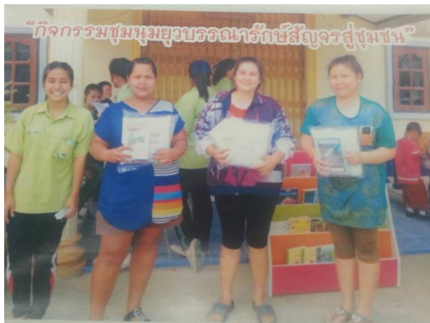
ภาพที่ 4.15 กิจกรรมชุมนุมยุวบรรณารักษ์สัญจรสู่ชุมชน

ผลการจัดกิจกรรมชุมนุมยุวบรรณารักษ์สัญจรสู่ชุมชน คือ ทำให้นักเรียนมีนิสัยรักการอ่าน รู้จักการใช้เวลาว่างให้เกิดประโยชน์ในการหาความรู้จากการอ่านหนังสือ และรู้จักสร้างความสัมพันธ์อันดีระหว่างชุมชนและองค์กรที่เกี่ยวข้อง