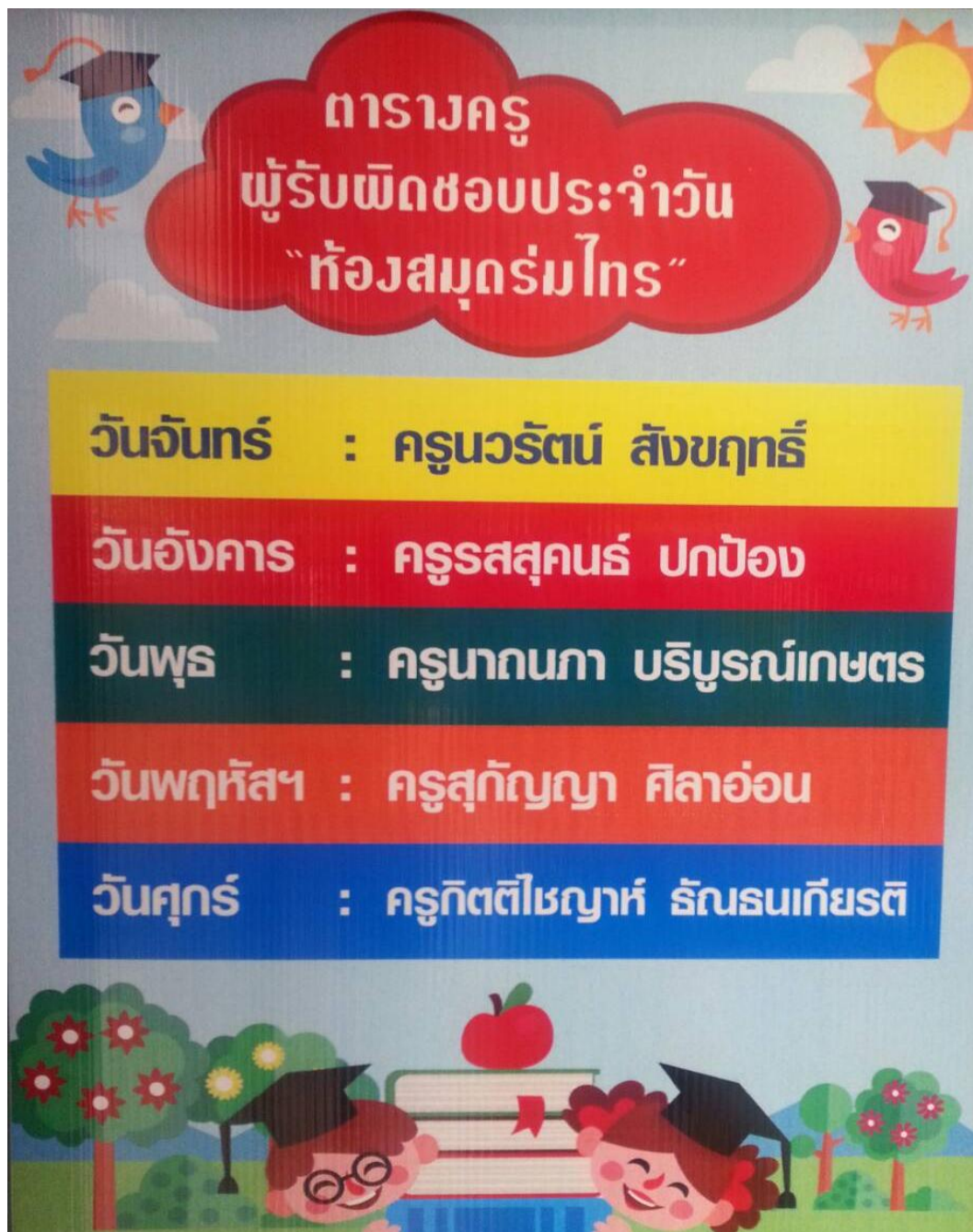
ภาพที่ 4.9 ตัวอย่างตารางเวรการจัดครูบรรณารักษ์ห้องสมุดโรงเรียนชนาคารอมสิน

การจัดครูอยู่เวรบรรณารักษ์ทุกวัน แสดงได้ดังภาพตารางเวรการจัดครูบรรณารักษ์ดังนี้