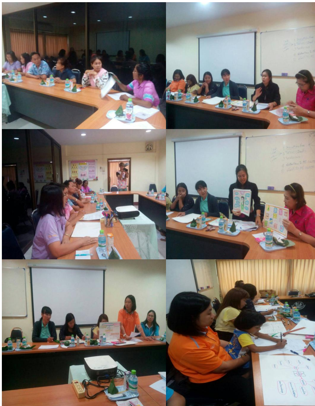
ภาพที่ 4.1 การมีส่วนร่วมในการสนทนากลุ่ม (Focus Group Discussion) สภาพและความต้องการของผู้ใช้ห้องสมุดของห้องสมุดโรงเรียนธนาคารออมสิน กลุ่มผู้บริหาร ครูผู้สอน

รวบรวมข้อมูลโดยมี ผู้บริหารสถานศึกษา จำนวน 3 คน ครูผู้สอน จำนวน 12 คน และ นักเรียนชั้น ประถมศึกษาปีที่ 4 ถึงชั้นมัธยมศึกษาปีที่ 6 จำนวนชั้นละ 2 คน จำนวน 18 คน รวมทั้งสิ้น 33 คน มีส่วนร่วมในการสนทนากลุ่ม (Focus Group Discussion) ซึ่งแสดงได้ดังภาพ 4.1 ดังนี้