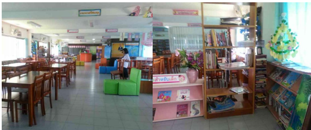
ภาพที่ 4.5 การตกแต่งห้องสมุดให้มีบรรยากาศที่เอื้อต่อการอ่านและการเรียนรู้

2.3 การปรับปรุงบรรยากาศภายนอกของห้องสมุดโรงเรียน ให้สดชื่น แสดงได้ดังภาพที่