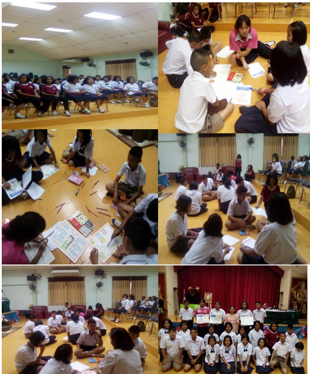
ภาพที่ 4.2 การมีส่วนร่วมในการสนทนากลุ่ม (Focus Group Discussion) สภาพและความต้องการของผู้ใช้ห้องสมุดของห้องสมุดโรงเรียนธนาคารออมสิน กลุ่มนักเรียน