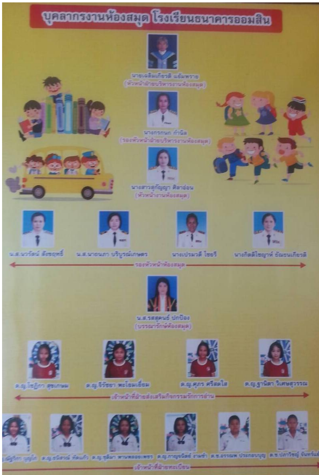
ภาพที่ 4.8 โครงสร้างบุคลากรงานห้องสมุดของห้องสมุดโรงเรียนธนาคารออมสิน