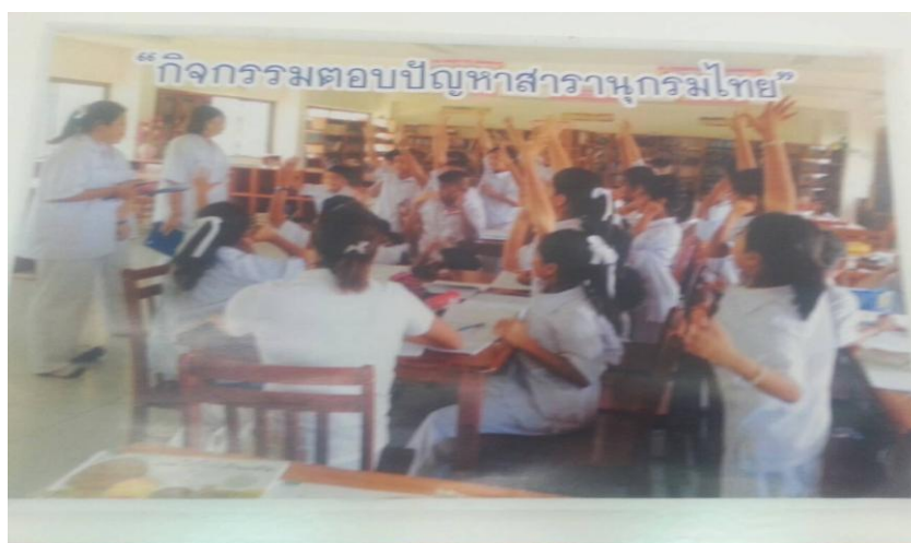
ภาพที่ 4.12 กิจกรรมตอบปัญหาสารานุกรมไทย

ผลการจัดกิจกรรมเล่านิทานก่อนเรียน คือ นักเรียนให้ความสนใจและเพื่อกระตุ้นให้นักเรียนมีความอยากรู้ อยากร้อ่านจากหนังสือหลายประเภท เป็นการเปิดความคิดให้กว้างและให้มีการอ่านอย่างต่อเนื่อง