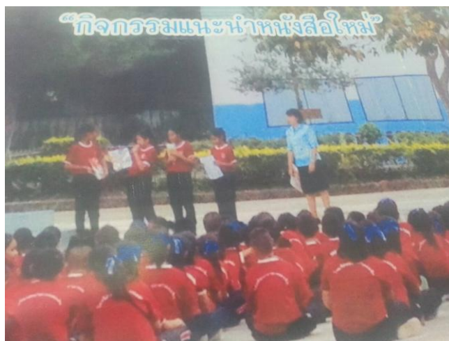
ภาพที่ 4.16 กิจกรรมแนะนำหนังสือใหม่

ผลการจัดกิจกรรมชุมนุมยุวบรรณารักษ์สัญจรสู่ชุมชน คือ ทำให้นักเรียนมีนิสัยรักการอ่าน รู้จักการใช้เวลาว่างให้เกิดประโยชน์ในการหาความรู้จากการอ่านหนังสือ และรู้จักสร้างความสัมพันธ์อันดีระหว่างชุมชนและองค์กรที่เกี่ยวข้อง