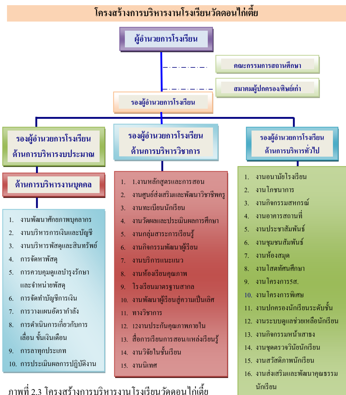
ภาพที่ 2.3 โครงสร้างการบริหารงานโรงเรียนวัดดอนไก่อี๋ย

โรงเรียนวัดดอนไก่อี๋ยแบ่งโครงสร้างการบริหารงานเป็น 4 ด้าน ได้แก่ ด้านการบริหาร วิชาการ ด้านการบริหารงบประมาณ ด้านการบริหารงานบุคลากร และด้านบริหารทั่วไปและผู้บริหาร ขีดหลักการบริหาร/มีเทคนิคการบริหารแบบการพัฒนาตามกระบวนการ P D C A , SBM