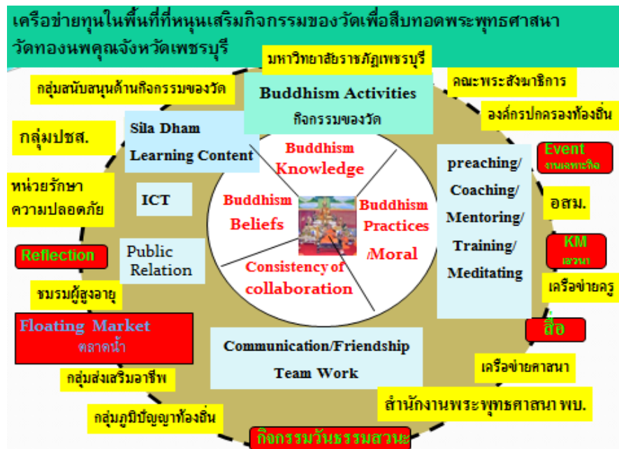
ภาพที่ 2.2 ตัวแบบทางความคิดของการสืบทอดพระพุทธศาสนาโดยการบริหารเครือข่ายทุนในพื้นที่ด้วยหลักศาสนธรรมของวัดทองนพคุณ จังหวัดเพชรบุรี

จากภาพที่ 2.2 เป็นตัวแบบทางความคิดของการสืบทอดพระพุทธศาสนาโดยการบริหารเครือข่ายทุนในพื้นที่ด้วยหลักศาสนธรรมของวัดทองนพคุณ จังหวัดเพชรบุรี จากประสบการณ์ของตนเองซึ่งเป็นเจ้าอาวาส วัดทองนพคุณ โดยใช้หลักการทฤษฎีแนวคิดและงานวิจัยที่เกี่ยวข้องสังเคราะห์จนได้เครือข่ายทุนในพื้นที่ทั้ง 13 เครือข่าย ได้แก่ 1) มหาวิทยาลัยราชภัฏเพชรบุรี ซึ่งมีหน้าที่ให้คำปรึกษา ให้ความรู้และช่วยประสานงานในการปฏิบัติกิจกรรม 2) พระสังฆาธิการให้ความรู้และคำปรึกษาเกี่ยวกับกิจกรรมในทางพระพุทธศาสนา 3) องค์กรปกครองส่วนท้องถิ่นประสานด้านกิจกรรมร่วมกับกลุ่มเครือข่ายอื่นๆ 4) อสม. ให้การสนับสนุนดูแลด้านสุขภาพของผู้เข้าร่วมกิจกรรม 5) เครือข่ายครูเข้าร่วมกิจกรรมพร้อมก็นำนักเรียนเข้าร่วมกิจกรรมของวัด 6) เครือข่ายศาสนาให้ข้อความรู้แลกเปลี่ยนความคิดเห็นในแต่ละกิจกรรมทางพระพุทธศาสนา 7) สำนักงานพระพุทธศาสนาให้คำปรึกษาในด้านศาสนาพิธี 8) กลุ่มสภุมิปัญญาท้องถิ่นร่วมกิจกรรมและนำเสนอกิจกรรมของท้องถิ่นที่เป็นประโยชน์ 9) กลุ่มส่งเสริมอาชีพเข้าร่วมกิจกรรมและสาธิตขั้นตอนการประกอบอาชีพ 10) ชมรมผู้สูงอายุเป็นที่ปรึกษาในด้านข้อมูลที่เป็นประโยชน์ด้านกิจกรรมต่างๆ ตามขนบธรรมเนียมประเพณีเดิมๆ ที่ปฏิบัติสืบทอดกันมา 11) กลุ่มเครือข่ายรักษาความปลอดภัยมีหน้าที่ดูแลความปลอดภัยและความสะดวกแก่ผู้เข้าร่วมกิจกรรม 12) เครือข่ายประชาสัมพันธ์ให้การสนับสนุนประชาสัมพันธ์กิจกรรมต่างๆ และการสื่อสารด้านต่างๆ ของวัด 13) กลุ่มสนับสนุนด้านการจัดกิจกรรมของวัดให้การอุปถัมภ์ด้านกำลังทรัพย์วัสดุอุปกรณ์สิ่งของเครื่องใช้สำหรับการจัดกิจกรรม