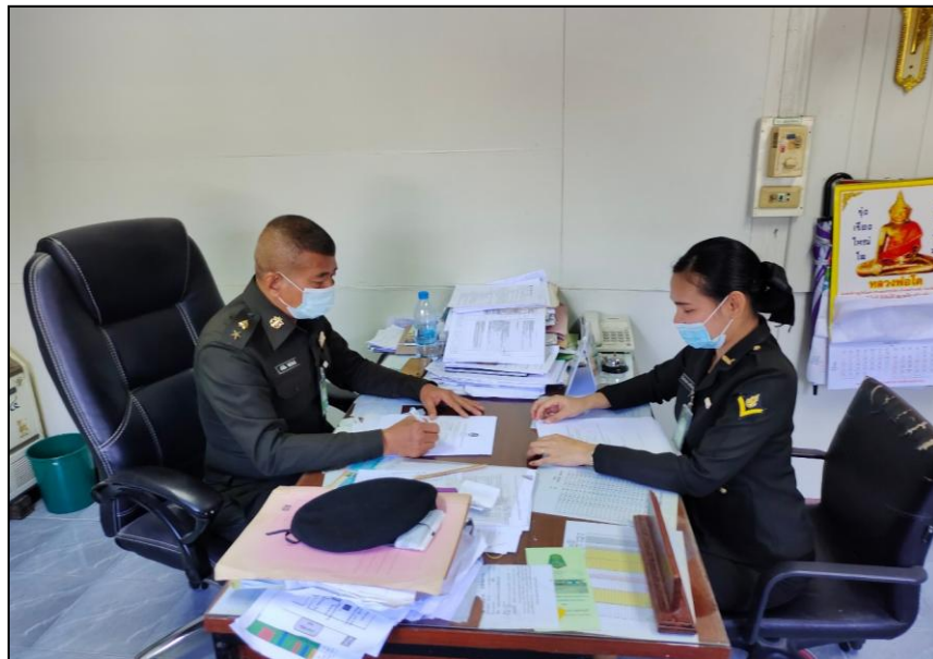
พ.ท. ธวัชชัย พิศยังศิลป์ หัวหน้าฝ่ายยุทธโยธา มณฑลทหารบกที่ 15 สัมภาษณ์วันที่ 2 มีนาคม 2564