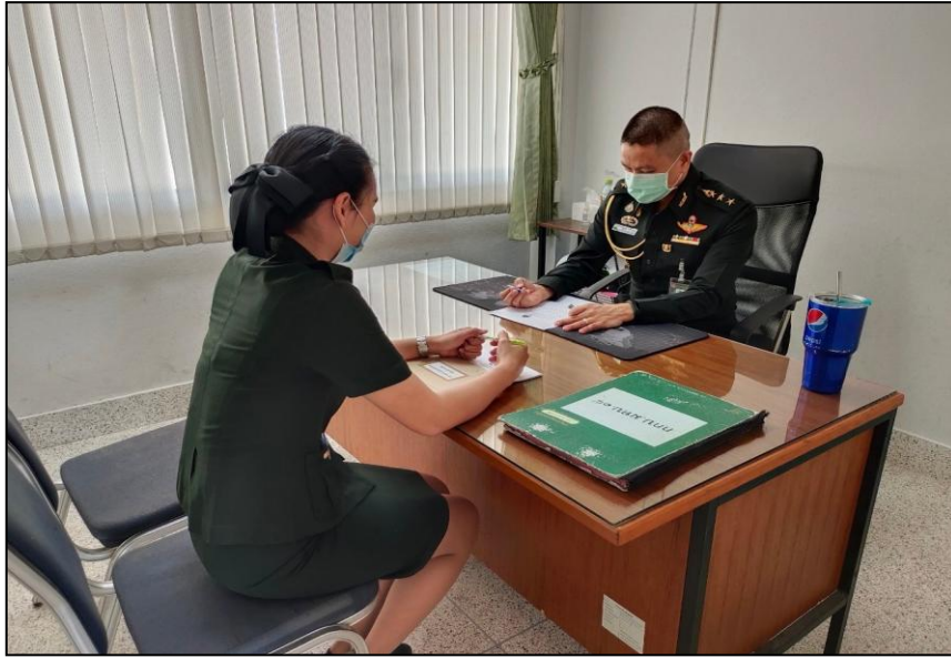
พ.อ.วุฒิชัย ปานแยม หัวหน้าฝ่ายกองกำลังบำรุง มณฑลทหารบกที่ 15 สัมภาษณ์วันที่ 5 มีนาคม 2564