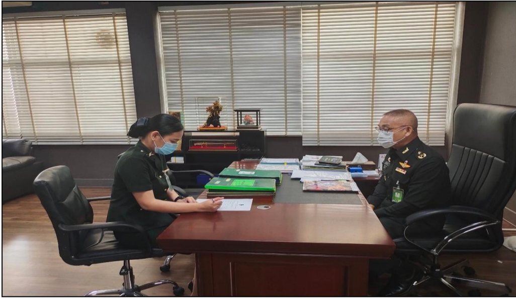
พล.ต. ประยุทธ์ อุ่นอบ ผู้บัญชาการมณฑลทหารบกที่ 15 สัมภาษณ์วันที่ 15 มีนาคม 2564