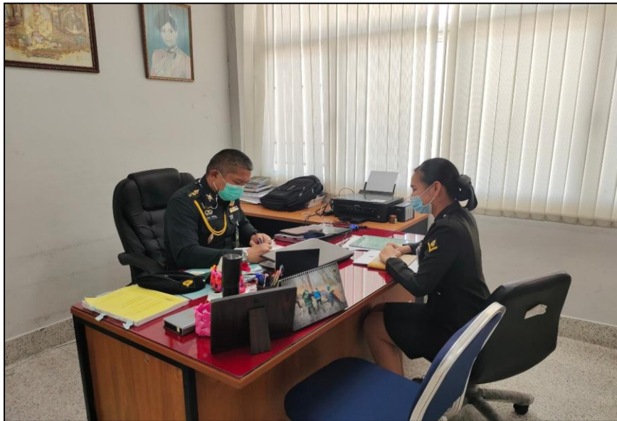
พ.อ. เสริมพงษ์ วงศ์สิทธิโชค หัวหน้าฝ่ายกองยุทธการ มณฑลทหารบกที่ 15 สัมภาษณ์วันที่ 5 มีนาคม 2564