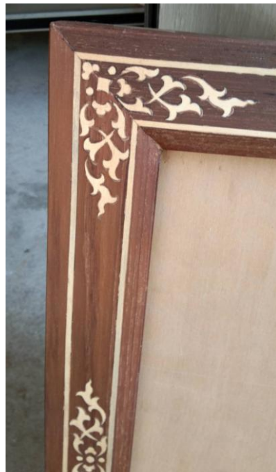
ช่างแกะสลักไม้โมก

ภาพที่ 4.12 ตัวอย่างงานสกุลช่างเมืองเพชร ที่มา : ประภาส อินทนู 24 พฤษภาคม 2564