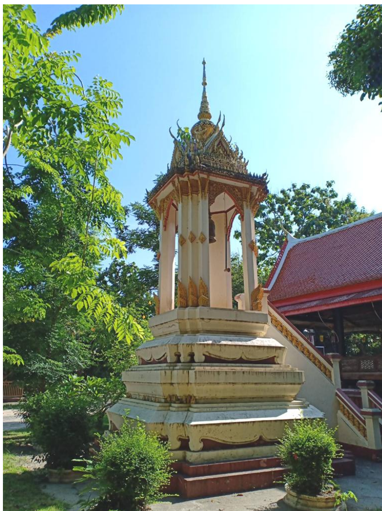
ภาพที่ 4.8 หอรระฆัง วัดเกาะแก้วสุทธาราม ที่มา : ประภาส อินทนู 24 พฤษภาคม 2564

หอรระฆัง หอรระฆังเก่าตั้งอยู่ตรงประตูทางขึ้นด้านหลังกุฏิของวัดเกาะ เยื้องศาลา ทำนํ้ามเหศวร จุดเด่นของหอรระฆังอยู่ที่ช่อฟ้า เป็นแบบอยุธยาโดยเฉพาะมีเพียงไม่กี่แห่งในจังหวัด เพชรบุรี ตรงส่วนปากจุ่มคว่ำลงเรียกว่า “ช่อฟ้าปากครุฑ” แต่ในจังหวัดเพชรบุรีมักนิยมเรียกว่า “ช่อฟ้าเล็บเหยี่ยว” หรือช่อฟ้าหน้าคว่ำ จำง่ายดี