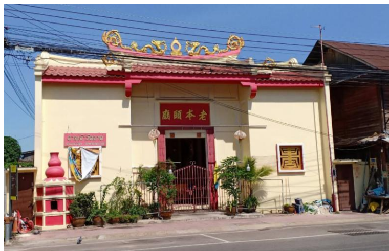
ศาลเจ้าวัดลาด