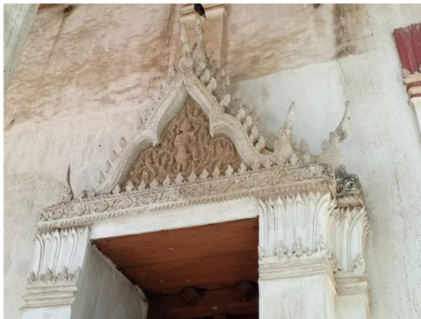
ภาพที่ 4.11 ภาพสถาปัตยกรรมต่างๆ ภายในวัดเกาะแก้วสุทธาราม 24 พฤษภาคม 2564