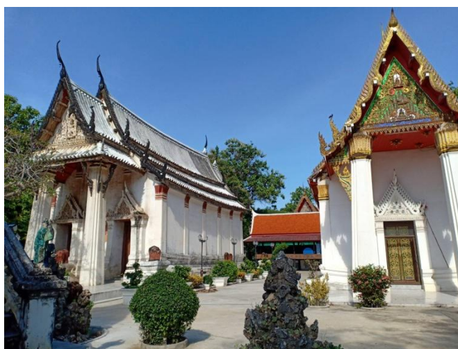
ภาพที่ 4.2 วัดเกาะสุทธาราม

ประชาชนในชุมชนวัดเกาะส่วนใหญ่นับถือศาสนาพุทธ โดยมีวัดในพุทธศาสนาที่ตั้งอยู่ในเขตพื้นที่ชุมชน จำนวน 1 วัด คือ วัดเกาะสุทธาราม ศาลเจ้าวัดลาด และศาลเจ้าบ้านปิ่น