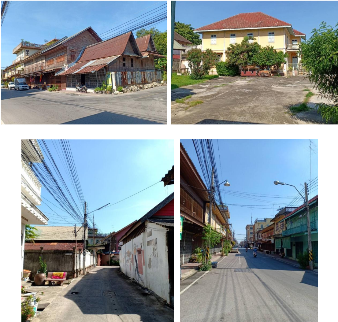
ภาพที่ 4.1 สภาพบ้านเรือน ชุมชนวัดเกาะ