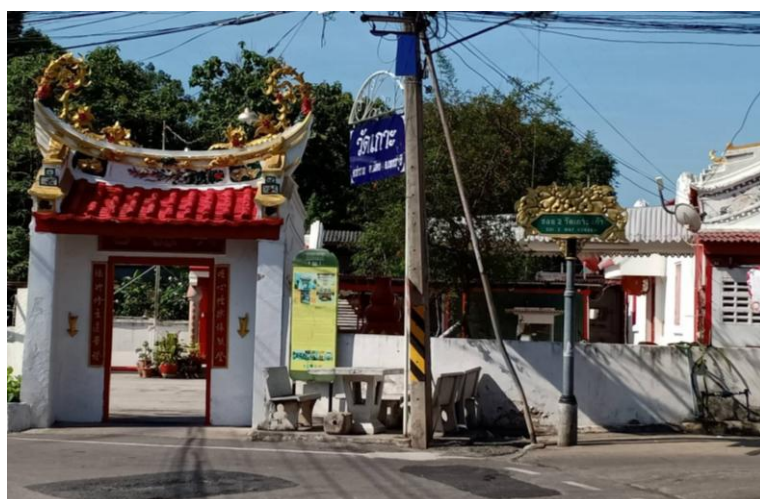
ศาลเจ้าบ้านปิ่น

ภาพที่ 4.3 ศาลเจ้าจีน ชุมชนวัดเกาะ ที่มา : ประภาส อินทนู 24 พฤษภาคม 2564