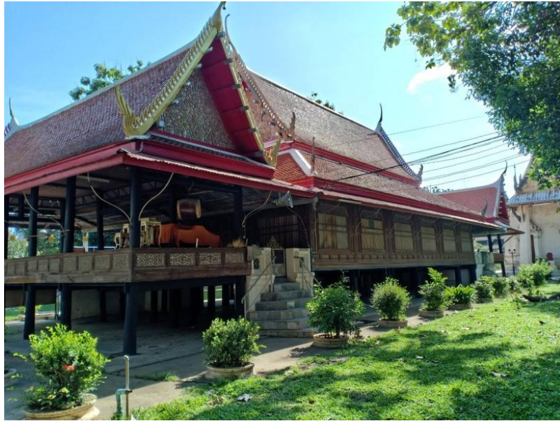
ภาพที่ 4.6 ศาลาการเปรียญ วัดเกาะแก้วสุทธาราม ที่มา : ประภาส อินทนู 24 พฤษภาคม 2564

กุฎิสามห้อง ท่านผู้สร้างนั้นสร้างขึ้นเพื่อซ่อมฝมือก่อนที่จะลงมือสร้างศาลาการเปรียญหลังดังกล่าว วัดเกาะจึงมีกุฎิสามห้องทรงไทยอันสวยงามทั้งเครื่องบนฝาครอบนอกและฝาเพ็ยม เป็นที่เชิดหน้าชูตาของวัดได้อีกสิ่งหนึ่ง กุฎิหลังนี้มีจารึกติดอยู่ที่ฝาเพ็ยมด้านใน ต่อมาภายหลังเมื่อทางวัดจำเป็นต้องขยายกุฎิให้กว้างขวางขึ้นต้องรื้อจารึกออก