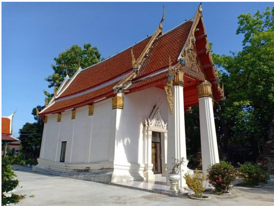
ภาพที่ 4.5 วิหาร วัดเกาะแก้วสุทธาราม

วิหาร ตั้งอยู่เคียงข้างพระอุโบสถแต่มีลักษณะเรียบง่ายกว่ามาก แม้เสาด้านหน้าจะเป็นเสาย่อมุมสิบสองเช่นกัน แต่ไม่มีคันทวยค้ำยันและประตูทั้งด้านหน้าและด้านหลังก็ไม่มีลายปูนปั้นประดับซุ้มหน้าบันก็มีลักษณะเรียบ ๆ ไม่มีลวดลาย แต่ด้านข้างเจาะหน้าต่างด้านละ 1 ช่อง