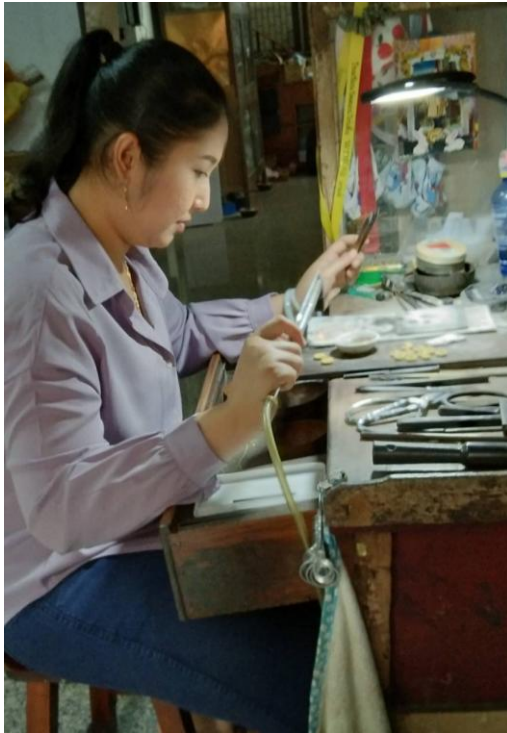
ช่างทำทอง