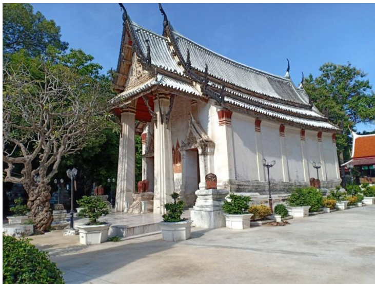
ภาพที่ 4.4 พระอุโบสถ วัดเกาะแก้วสุทธาราม ที่มา : ประภาส อินทนู 24 พฤษภาคม 2564

พระอุโบสถ มีขนาดไม่ใหญ่นัก ทรงสูง ฐานหย่อนท้องช้างหรืออ่อนโค้งตั้งสำเภา ตัวอาคารเป็นรุ่นอยุธยาแท้ๆ เพราะไม่มีการเจาะช่องหน้าต่าง แต่ด้านหน้าและด้านหลังเจาะประตูด้านละ 2 ช่อง เหนือประตูประดับซุ้มลายปูนปั้น ด้านหน้ามีเสาสี่เหลี่ยมย่อมุมสิบสอง 2 ต้น และมีคันทวยแกะไม้ค้ำยันหลังคาไว้ด้วย ส่วนหน้าบันประดับลายปูนปั้นรูปเทพพนม รอบโบสถ์มีเสมาหินทรายเป็นเสมาคู่ ตั้งบนฐานสูง มีลวดลายบนตัวเสมา จากลวดลายดังกล่าวบ่งชี้ว่าเป็นเสมารุ่นเก่ากว่าสมัยอยุธยา