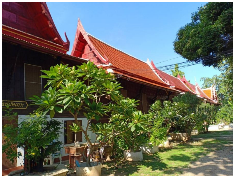
ภาพที่ 4.7 กุฎิสามห้อง วัดเกาะแก้วสุทธาราม ที่มา : ประภาส อินทนู 24 พฤษภาคม 2564

กุฎิสามห้อง ท่านผู้สร้างนั้นสร้างขึ้นเพื่อซ่อมฝมือก่อนที่จะลงมือสร้างศาลาการเปรียญหลังดังกล่าว วัดเกาะจึงมีกุฎิสามห้องทรงไทยอันสวยงามทั้งเครื่องบนฝาครอบนอกและฝาเพ็ยม เป็นที่เชิดหน้าชูตาของวัดได้อีกสิ่งหนึ่ง กุฎิหลังนี้มีจารึกติดอยู่ที่ฝาเพ็ยมด้านใน ต่อมาภายหลังเมื่อทางวัดจำเป็นต้องขยายกุฎิให้กว้างขวางขึ้นต้องรื้อจารึกออก