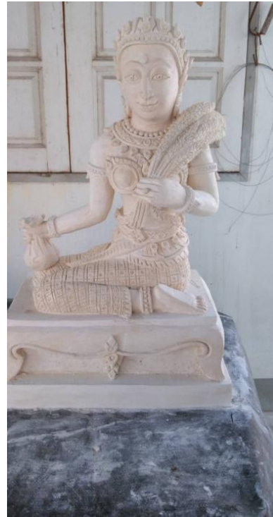
ช่างปูนปั้น