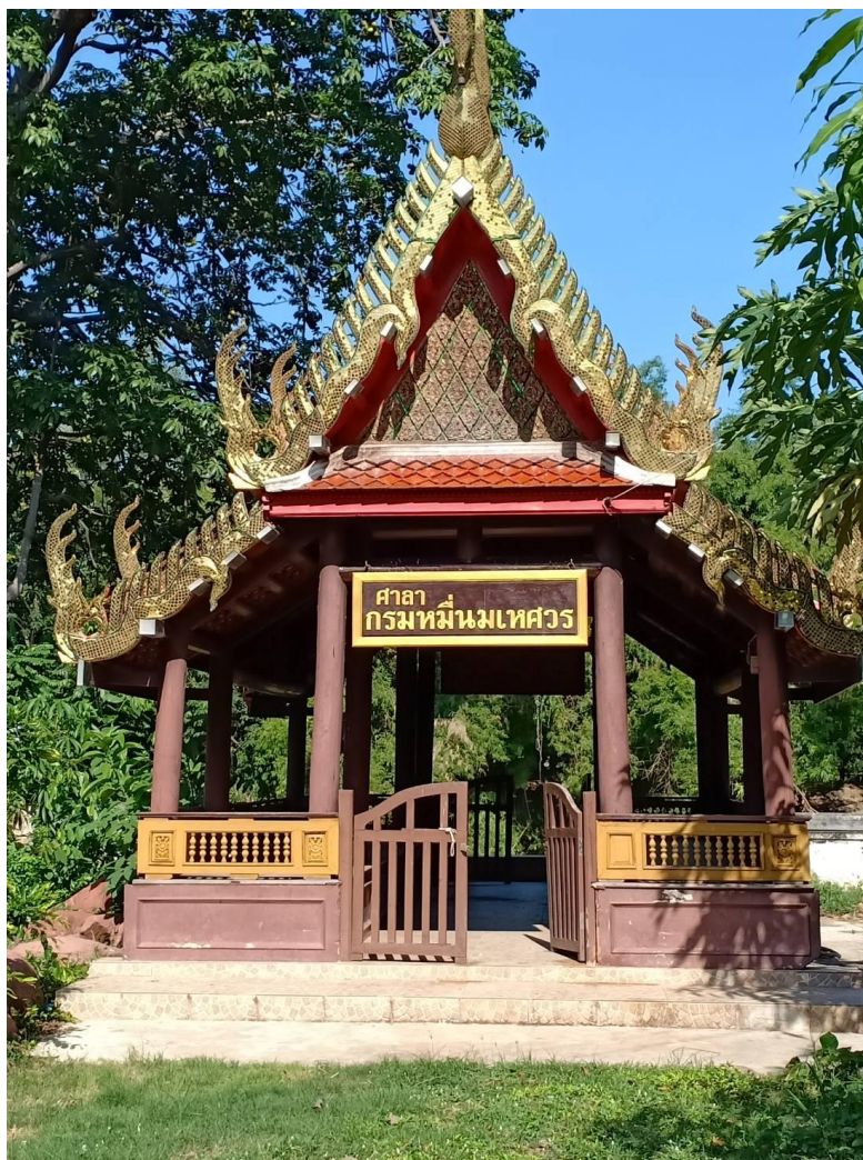
ภาพที่ 4.9 ศาลาท่าน้ำ (ศาลามเหศวร) วัดเกาะแก้วสุทธาราม 24 พฤษภาคม 2564

ศาลาท่าน้ำ (ศาลามเหศวร) สร้างขึ้นสมัยพระอริการดิษฐ์ เจ้าอาวาสวัดเกาะองค์ที่ 2 (พ.ศ.2400-2422) สร้างขึ้นเพื่อถวายเจ้านายต่างกรมพระนามกรมหมื่นมเหศวร เมื่อสร้างเสร็จจึงตั้งชื่อศาลาตามพระนามว่า “ศาลามเหศวร”